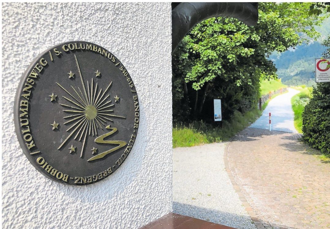
«Der Schnelligkeit entfliehen»: Die Pfade des einstigen Kolumbans, welche auch durch Teile des Werdenbergs führen, machen es möglich.

Bei überschüssigem Gepäck gibt es das Angebot, bei welchem man dieses bequem von Etappe zu Etappe transportieren lassen kann. Auch an Übernachtungsmöglichkeiten, wie Hotels oder Jugendherbergen mangelt es in der Nähe des Weges nicht. Deshalb ist auf der Website Kolumbanweg.ch auch eine Karte aufgeschaltet auf der Hotels, Pensionen oder Jugendherbergen zwecks Übernachtung auf-