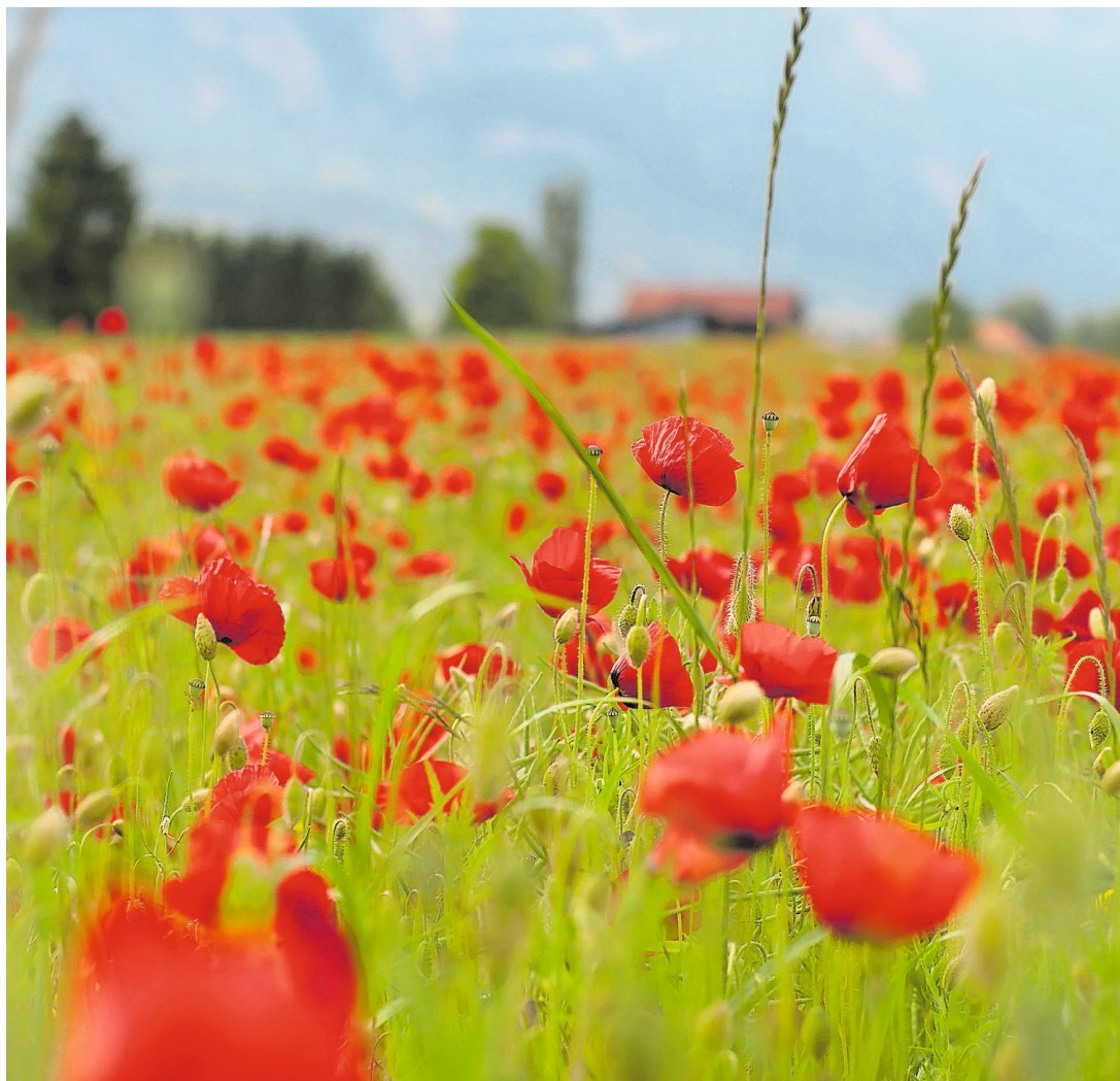
Leserbild Martina Gschwend fotografierte diese Mohnblumen.