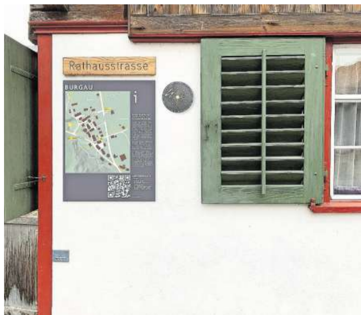
Vorgesehene Anordnung der Infotafel zum Kolumbansweg und der Plakette beim «Plätzli».

angekommen, wurde ihm vom dortigen König Theudebert II. ein Missionsauftrag auferlegt. Während diesem durchquerte der Mönch Teile unserer Region. So verläuft die Etappe 9 von Wattwil nach Magdenau, die Etappe 10 von Magdenau nach St. Gallen. 612 n. Chr. erreichte Kolumban sein Ziel in Bobbio, wo er ein weiteres Kloster errichtete. Drei Jahre später starb er im Alter von 75 Jahren in Bobbio. (pd)