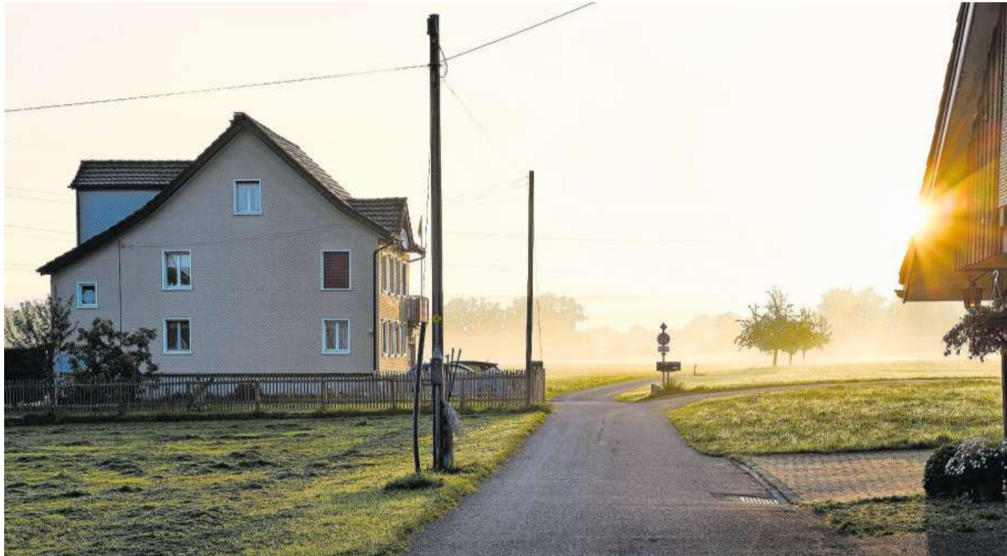
Im Weiler Burgau führt der Columbansweg – in Burgau wird die ältere Schreibweise Columban verwendet – Richtung Brückenkopf und abschliessend zur Columbanhöhle.

Auf der neunten Etappe der 500 Kilometer langen Route durch die Schweiz führt der Kolumbansweg von Magdenau nach St. Gallen. Auf dieser Strecke wandern die Pilger am Weiler Burgau vorbei. Dass Kolumban in diesem Weiler kein Unbekannter ist, davon zeugt die Tat-